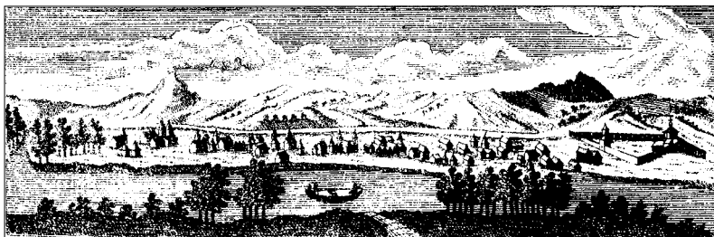
Нижний Камчатка острог (Der untere Kamtschatka Ostrog, Steller 1774)

жизнь самоубийством. Стеллер, находившийся в ту зиму в Большерецке, затем переехавший в Авачинскую бухту, должно быть знал об этих событиях, но его протест против Беринга был сравнительно осторожным, чтобы не подвернуть под угрозу свое участие в вожаемой поездке в Америку. Поэтому его протесты были прежде всего (сначала) направлены против казаков, относившихся зверски и совершенно не по-христиански к корякам (Steller 1741: 42–52). Но Беринг понял, что в конечном итоге эта критика относилась к ответственным за командование, и этого было достаточно, чтобы отстранить Стеллера от важных советов и решений до и во время путешествия, даже если первый (т.е. командор Беринг) уже не мог отказаться от участия последнего (ср. Frost 1994).