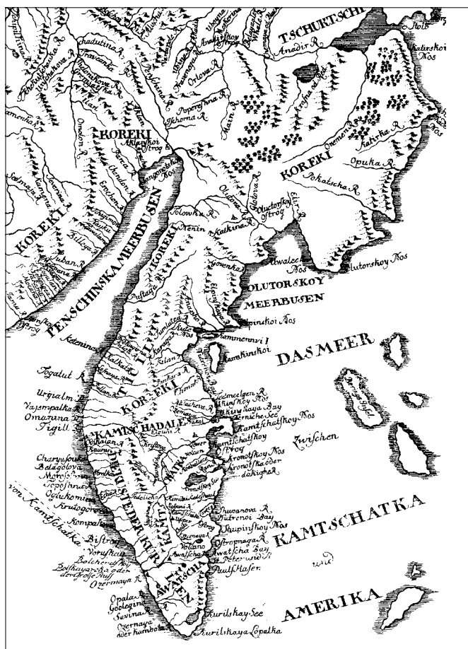
Карта местоположения Камчатки (Karte von der Lage Kamtschatkas, Steller 1774)

ограниченному умению капитана Хитрова, безопасно провести судно через южный мыс Камчатки, Стеллер провел зиму на западном побережье, где он познакомился с Крашенинниковым, проводившим уже три года естественнаучные работы. Знакомство было наверняка полезным для обоих.