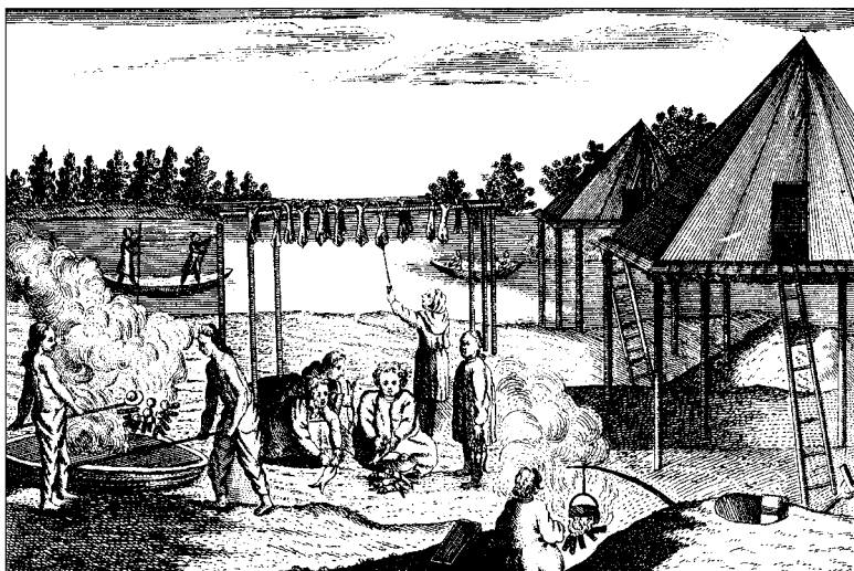
Камчадалское летное жилище (Eine kamtschadalische Sommerhütte, Steller 1774)

«Так как в Сибири весь домашний скарб необходимо везти с собой, то он довел его по возможности до минимума. Его сосуд для пива служил ему одновременно и для меда, и для водки. Вина он и не требовал. У него была всего одна посуда, из которой он ел, в которой он готовил себе еду. К тому же ему не требовался повар. Он готовил все сам, к тому же опять с малыми затратами, что суп, овощи и мясо одновременно клались и варились в одном котле [...] У него всегда было хорошее настроение, и чем больше беспорядка было вокруг него, тем веселее он был. При этом мы заметили, что вопреки всему беспорядку, каким казался его образ жизни, он был всегда пунктуален, и во всех своих делах был неутомим. [...] Для него ничего не стоило целый день не есть и не пить, если он мог сделать что-то плодотворное для науки.» (Gmelin 1751: 107 и д.)