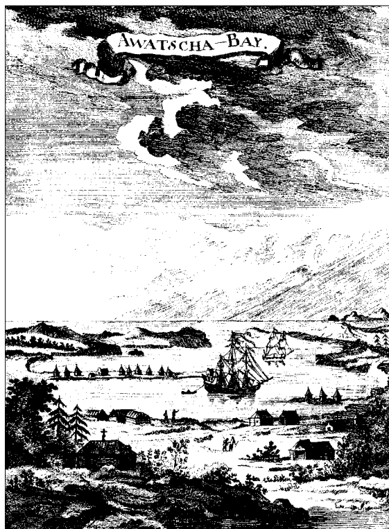
Авачинская бухта (Awatscha-Bucht, Steller 1774)