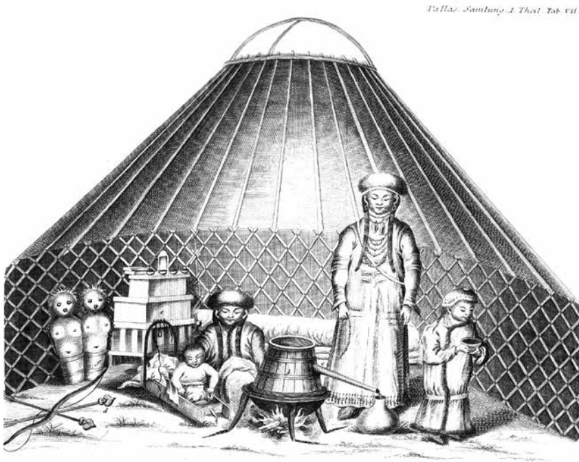
Abb. 4: „Eine Mongolische Filzhütte im Durchschnitt“ (Aus Pallas 1776–1801: Tafel 7).

Zur gleichen Zeit erschien jedoch eine andere Ausgabe von Pallas' Reise durch verschiedene Provinzen des Russischen Reichs in einem ausführlichen Auszuge , die in Frankfurt und Leipzig von Johann Georg Fleischer herausgegeben wurde (1776–1778). Dabei handelte es sich um einen Auszug für ein breiteres Publikum. Es ist zu vermuten, dass derselbe Verleger auch für andere populär gehaltene Auszüge aus Pallas' Werken verantwortlich war. Die Bücher ähneln nämlich einem ebenfalls illustrierten Auszug aus Georgis Bemerkungen, Merkwürdigkeiten verschiedener unbekannter Völker des Russischen Reichs (1777). 9