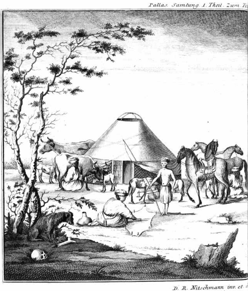
Abb. 3: „Eine kalmückische Familie mit ihrem Melkvieh“ (Aus: Pallas 1776–1801: Titelpuffer).

Kalmücken, Kirgisen, Baschkiren etc. (1773), Merkwürdigkeiten der Baschkiren, Metscheräken, Wogulen, Tataren etc. (1777a) und Merkwürdigkeiten der obischen Ostjaken, Samojuden, daurischen Tungusen, udinskischen Bergtataren etc. (1777b). Der WorldCat gibt an, dass die Auszüge von dem Publizisten August Wilhelm Hupel und dem Verleger Johann Friedrich Hartknoch in Riga zusammengestellt worden sind. 8 Als Herausgeber soll der bekannte Darmstädter Publizist, Redakteur und Naturforscher Johann Heinrich Merck (1741–1791) daran mitbeteiligt gewesen sein.