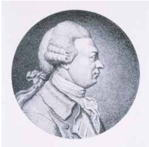
Abb. 2: Der junge Pallas (Kupferstich von Johann Conrad Krüger)

Peter Simon Pallas war Arzt und Naturforscher, der sich erst später zu einem Forschungsreisenden entwickelte. Geboren in Berlin am 22. September 1741 besuchte er ab 1754 Vorlesungen am Collegium medico-chirurgicum . Er studierte ab 1758 Medizin und Physik in Berlin, Halle, Göttingen und Leiden, wo er als 19-Jähriger über die Eingeweidewürmer promovierte (Pallas 1760). Er galt als hochbegabt und sprach neben Deutsch auch Latein, Griechisch, Englisch und Französisch; zudem lernte er Russisch und Tatarisch. 4 In Holland und England besuchte er die naturhistorischen Sammlungen und Menagerien. In Holland publizierte er zoologische Texte. Durch Veröffentlichungen versuchte er sich für eine wissenschaftliche Forschungsreise zu empfehlen. Ende 1766 bekam er über Johann Jacob Stählin einen Ruf der Zarin Katharina II. an die in den Jahren 1724–1725 in St. Petersburg gegründete Akademie der Wissenschaften. Im Juli 1767 traf er dort ein, wo er zuerst als Adjunkt, dann als Professor für Naturgeschichte tätig war (Abb. 2). Pallas befasste sich zunächst mit der Ordnung der Exponate der Kunstkamera . Im Mai 1768 wurde ihm die Vorbereitung und Leitung einer von fünf „physicalischen“ Akademie-Expeditionen anvertraut. Erst bei der Vorbereitung und Ausführung dieser Reisen rückte die Völkerkunde in sein näheres Blickfeld.